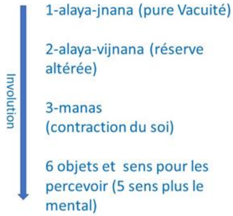
Figure 2 L'involution vue selon le Lankavatara Sutra